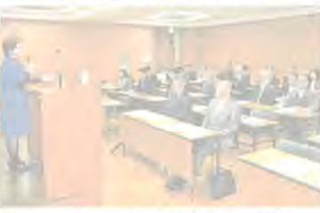
オーストラリアから観光客を呼び込むノウハウを学んだセミナー

オーストラリア人の旅行の特性やトレンドについて学ぶ「オーストラリア誘致セミナー」(岡山商工会議所主催)が2日、岡山市北区厚生町の同会議所で開かれた。観光や貿易などに関