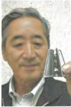
アストンが開発したスペーサー。上部のへばみに鉄筋をはめて固定する

駐車場の工事では、クックが外れる場合がある補強用の鉄筋を小型アブリ、そうすると鉄筋がロックなどの上に置 本来の位置に入らず、そこにコンクリー ひび割れの原因になるトを流し込み手法が一新開発のスペーサーの打設作業中にアブリは鉄製の二つの金物を