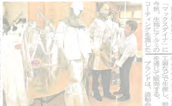
生地にアルミ加工を施し、防災性能を高めた「マックスダイナリス」の作業服

作業服製造のアリオカ(倉敷市児島)の町は、防災性能を高め、炎に触れても温度が上がりにくく、燃えにくいのが特徴。前掛け(店頭想定価格4200円、税別)や袖付きのエプロン(同7500円)のほか、耐熱性などに優れた炭素繊維やアラミド繊維で作るコート(同4万~5万円)などをそろえた。本社工場などで生産し、卸を通じて販売する。ブランドは、造船会社から誘客方策学ぶ